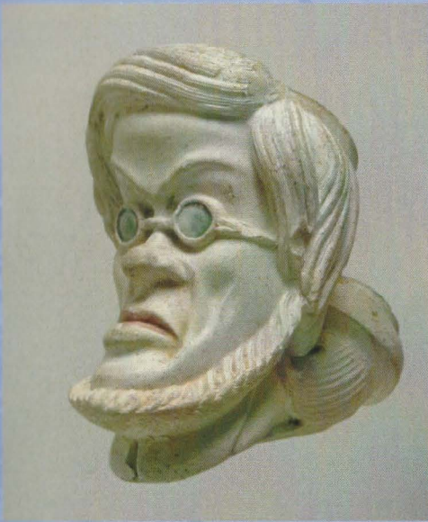
"Jules Favre" Gambier à Paris Tête nr. 714 Hoogte: 5,5 cm.