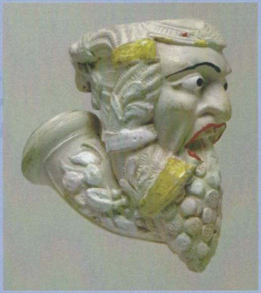
"Californie" Gambier à Paris Tête nr. 734 Hoogte: 5,7 cm.